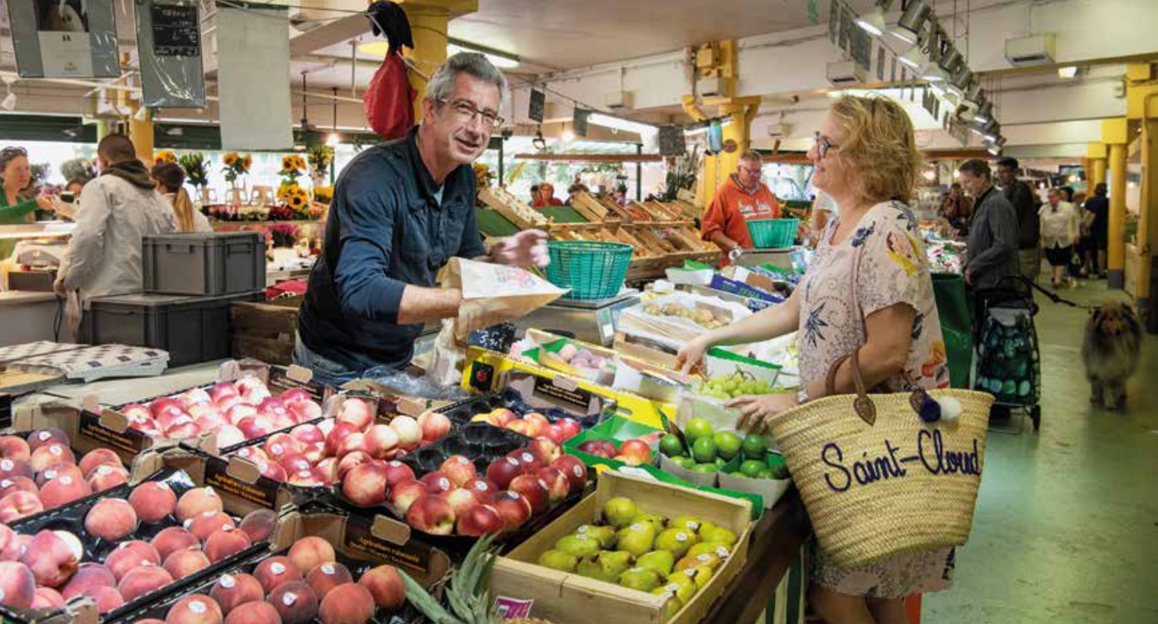
Le marché des Avelines aujourd'hui, 38-40, boulevard de la République.