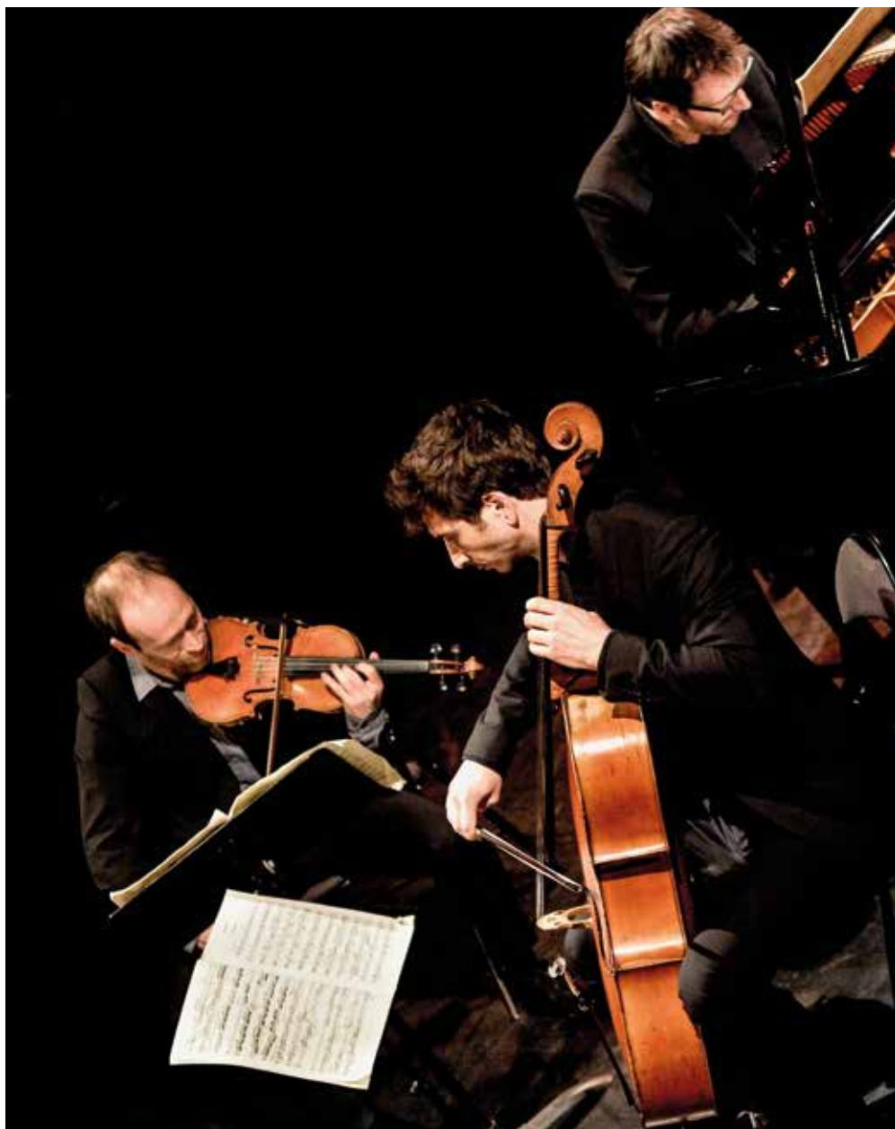
Le Trio Leos.