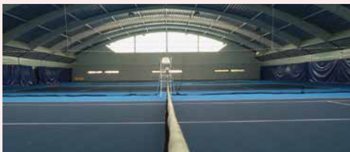
Tennis des Coteaux.

Par ailleurs, dans le cadre du plan pluriannuel d'entretien et de réfection des terrains de tennis, deux courts synthétiques dont un similaire à la terre battue viennent d'être refaits aux tennis des Tennerolles. Les joueurs peuvent désormais s'entraîner sur des terrains synthétiques de grande qualité qui reproduisent à s'y méprendre les qualités de la terre battue. Des travaux réalisés par la Ville en concertation avec l'UAS Tennis et la Fédération française de tennis.