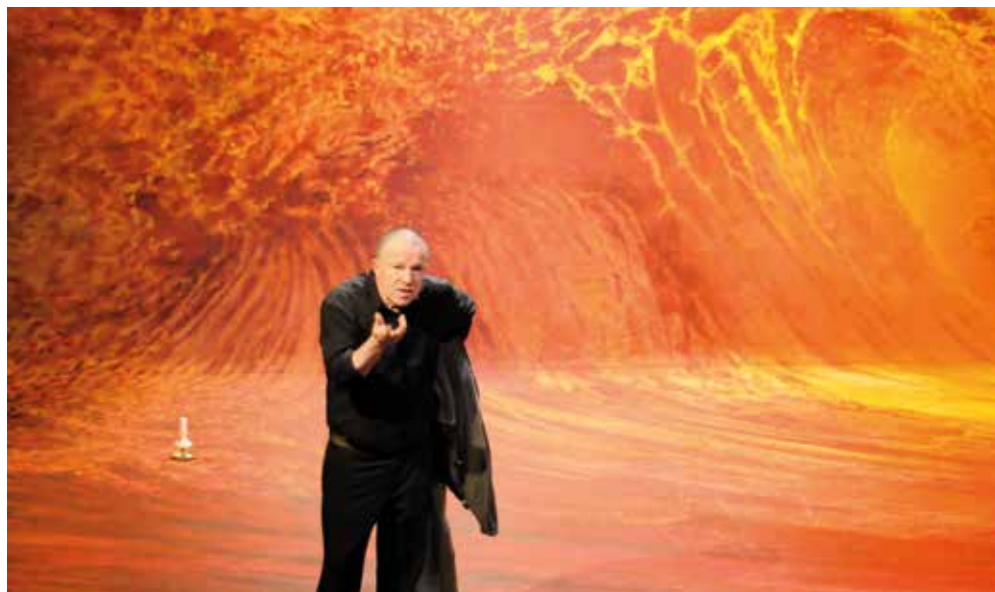
Braise et cendres .

Deux euros vingt nous interroge sur le mensonge, la fidélité et notre rapport à l'argent. Dans cette création théâtrale, le collectif prend le pas sur l'individualisme au service de la comédie, et c'est un bonheur pour le public!