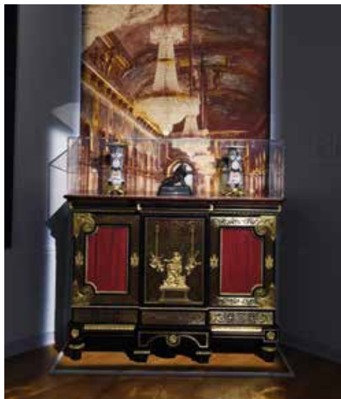
Louis-Édouard Lemarchand, Bas d'armoire vitré, sur un modèle d'André-Charles Boulle, 1843. Musée national des châteaux de Versailles et de Trianon, dépôt du musée du Louvre, inv.oA5463