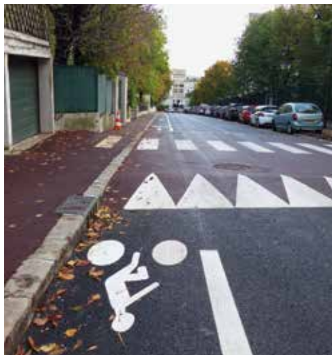
Piste cyclable et plateau traversant rue de Buzenval.