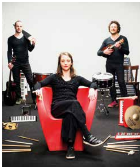
Le Petit roi.

Retrouvez le programme cinéma et réservez vos places sur www.cinema3pierrots.fr 6, rue du Mont-Valérien.