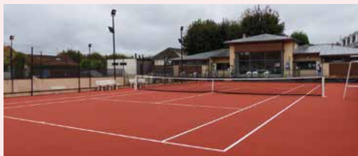
Tennis des Tennerolles.