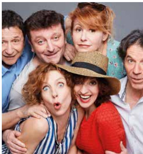
Deux euros vingt.