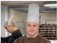
Guy Perault Chocolatier

Renseignements au 01 46 02 88 95 et sur www.noirblanclait.com 7 bis, rue Alexandre-Coutureau.