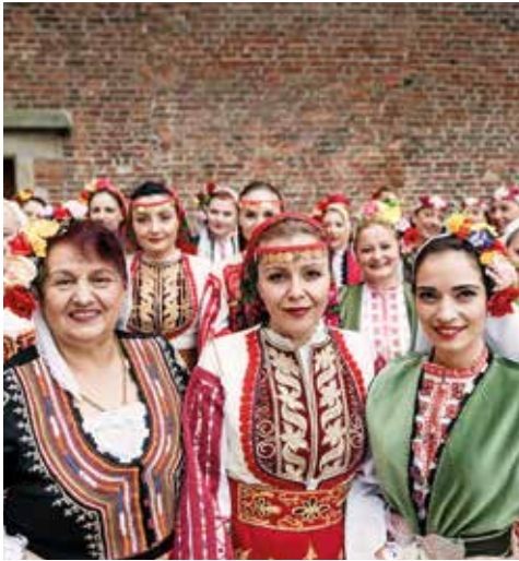
Le Mystère des Voix bulgares.

ébouriffante d'un beat-boxer, les quatorze chanteuses interprètent les chants traditionnels qui accompagnaient les fêtes de saints, les mariages et les travaux des champs dans les campagnes. Accompagnées par la chanteuse australienne Lisa Gerrard, ces femmes vous séduiront avec leur concert envoûtant !