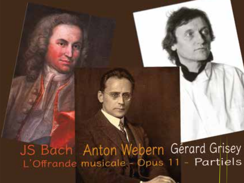
JS Bach Anton Webern Gérard Grisey L'Offrande musicale - Opus 11 - Partiels