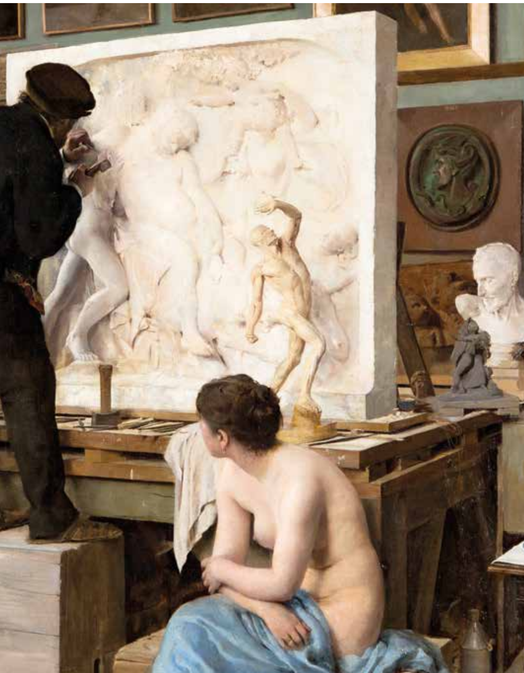
Un coin d'atelier de sculpteur Édouard Dantan (1848-1897) - Huile sur toile, 1880 93 x 130 cm - Signé et daté en bas E. Dantan 1880 Saint-Cloud, musée des Avelines

Catalogue La Collection disponible à la boutique du musée, 25 €.