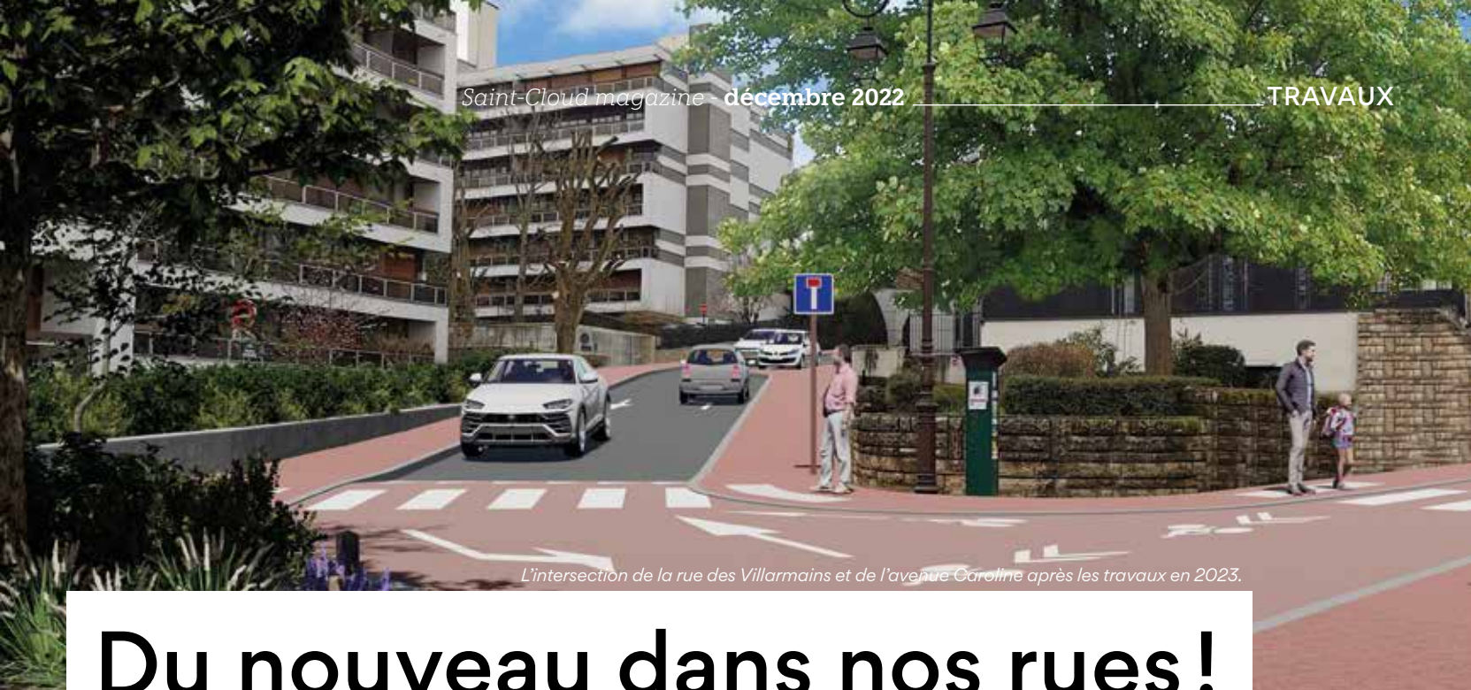
L'intersection de la rue des Villarmains et de l'avenue Caroline après les travaux en 2023.