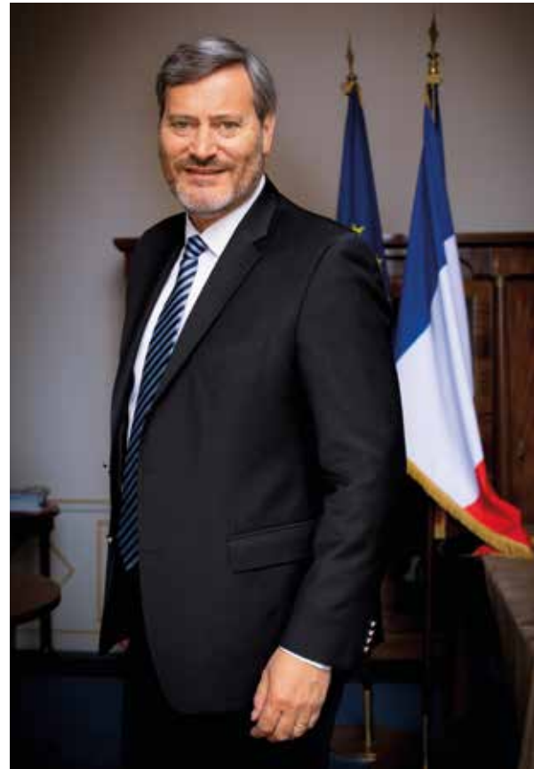
MAIRE DE SAINT-CLOUD VICE-PRÉSIDENT DU CONSEIL DÉPARTEMENTAL DES HAUTS-DE-SEINE