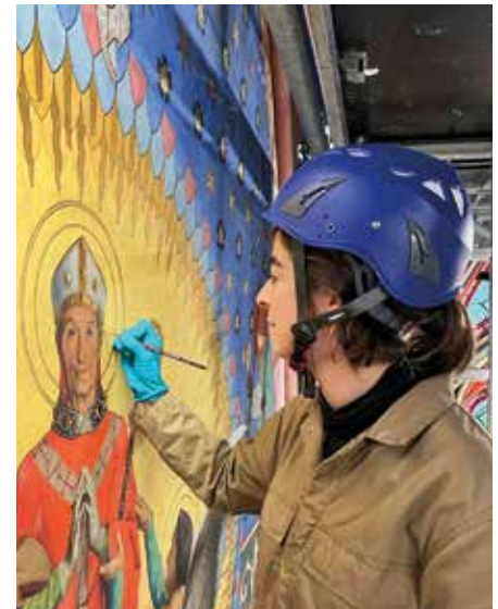
Chantier de restauration de Notre-Dame de Paris.

Facebook: @AtelierMCK Instagram: @atelier.mck