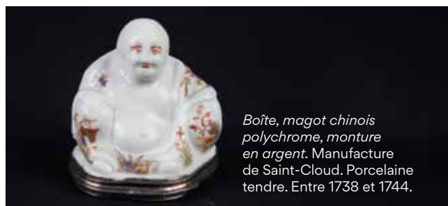
Boîte, magot chinois polychrome, monture en argent. Manufacture de Saint-Cloud. Porcelaine tendre. Entre 1738 et 1744.

Depuis le 14 octobre, une porcelaine de la manufacture de Saint-Cloud, un magot chinois mesurant environ 6 cm de hauteur est présentée dans l'exposition La duchesse Élisabeth-Charlotte (1676-1744). Dans l'intimité du pouvoir , qui a lieu jusqu'au 31 décembre 2023 au château de Lunéville, en Lorraine.