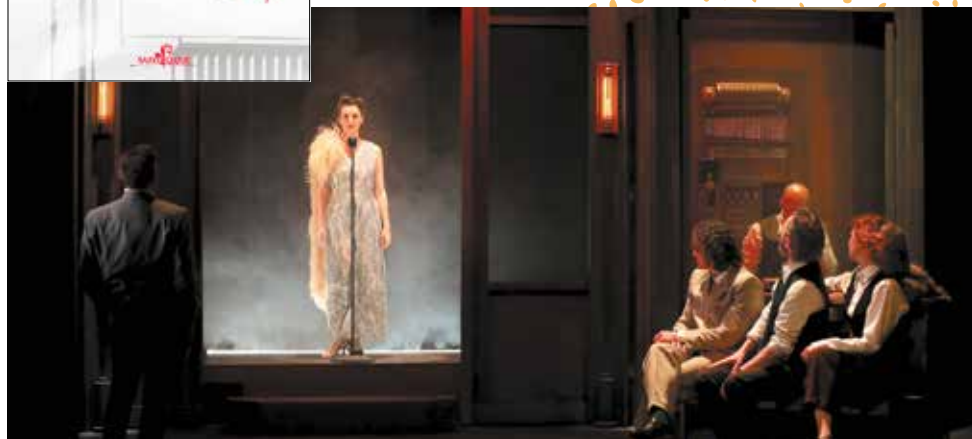
Le Chant des Lions.