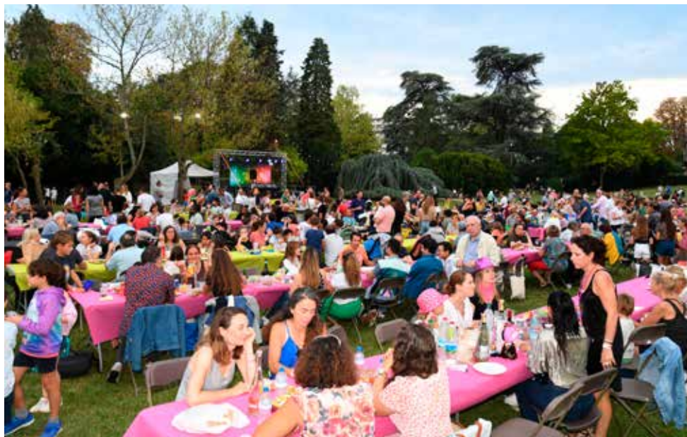
Grand Apéro 2024.