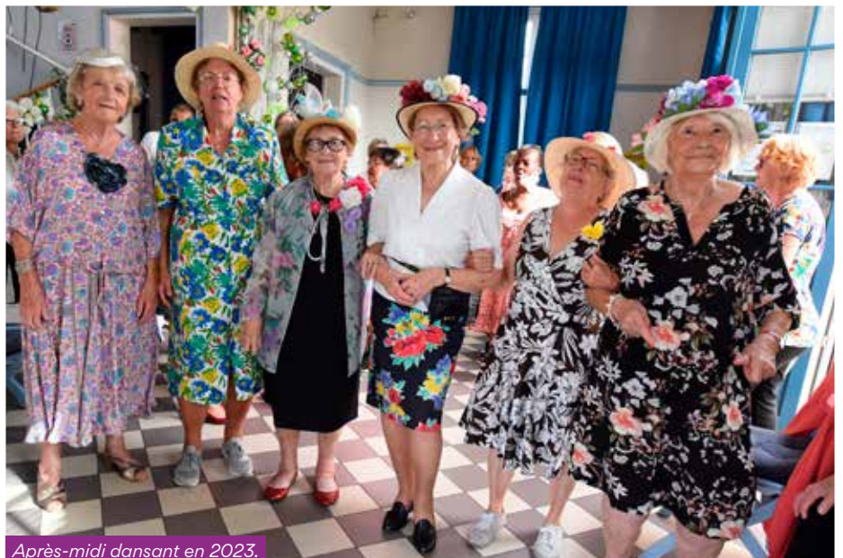
Après-midi dansant en 2023.