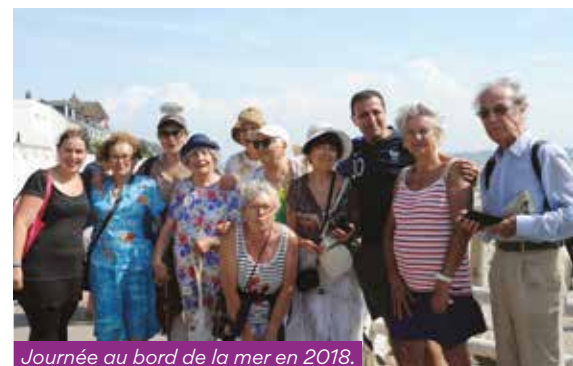
Journée au bord de la mer en 2018.