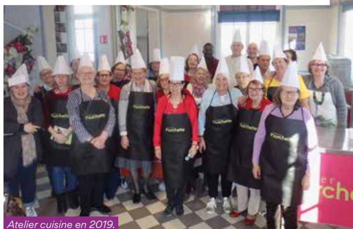
Atelier cuisine en 2019.