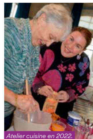
Atelier cuisine en 2022.