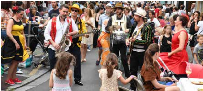
Lors de la Guinguette en 2023.