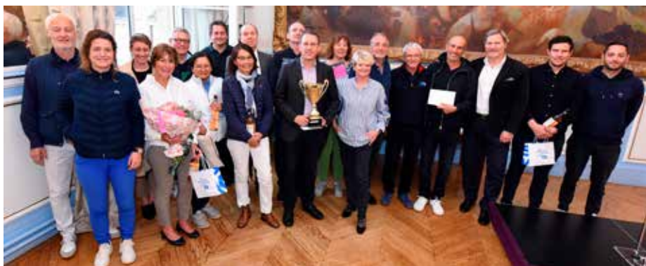
Remise du Trophée de golf.

Deux belles performances pour le Football Club de Saint-Cloud cette année :