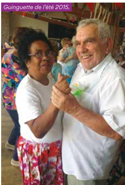
Guinguette de l'été 2015.