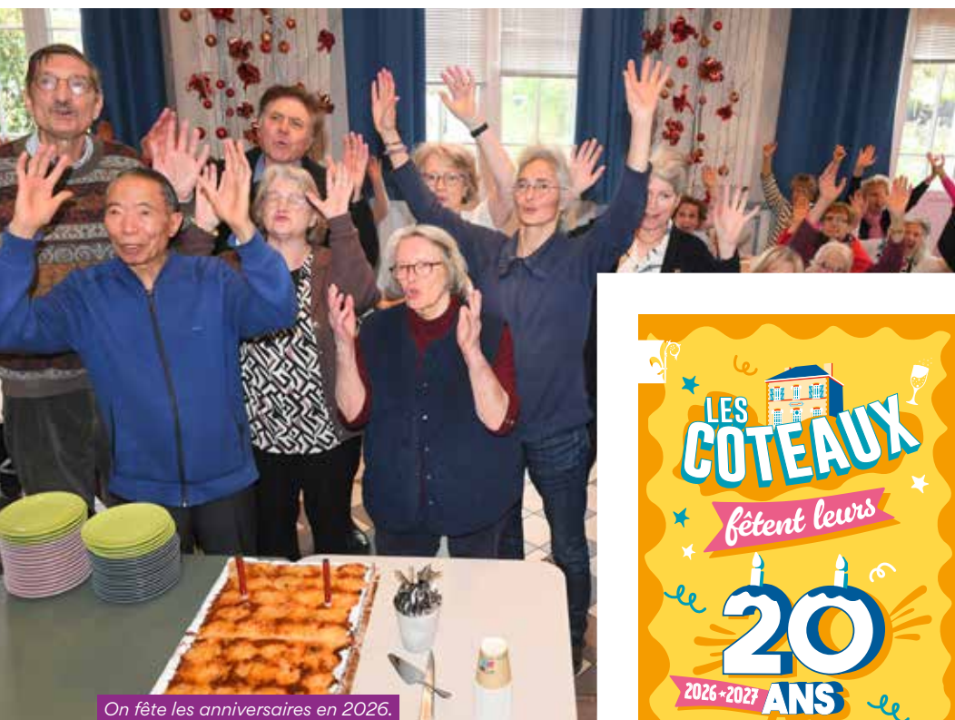
On fête les anniversaires en 2026.