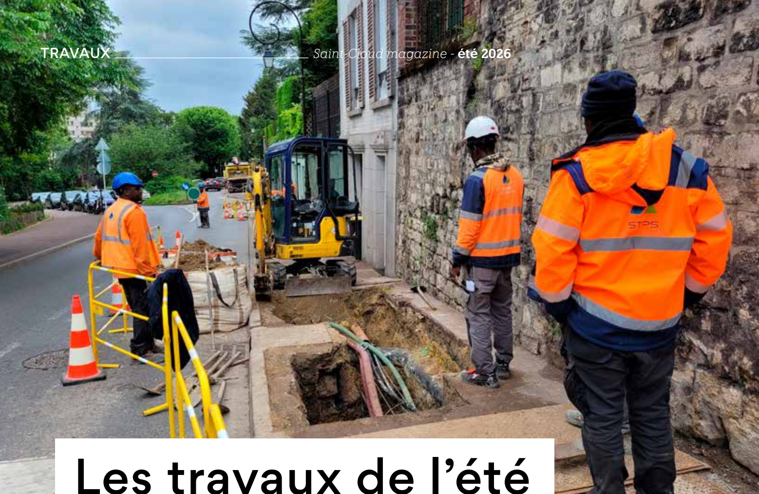
Travaux GRDF rue du Calvaire.