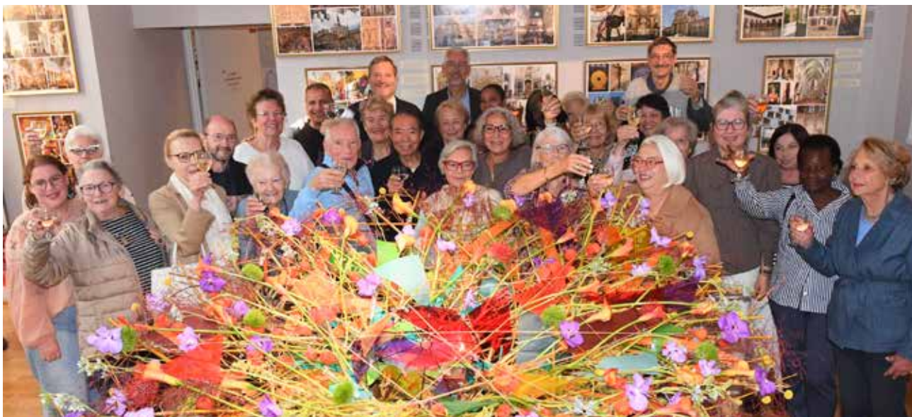
Inauguration de la Semaine Bleue en 2025.

Renseignements auprès de l'Espace d'animation des Coteaux au 01 46 89 64 86 ou à animation-seniors@saintcloud.fr 6, place Santos-Dumont.