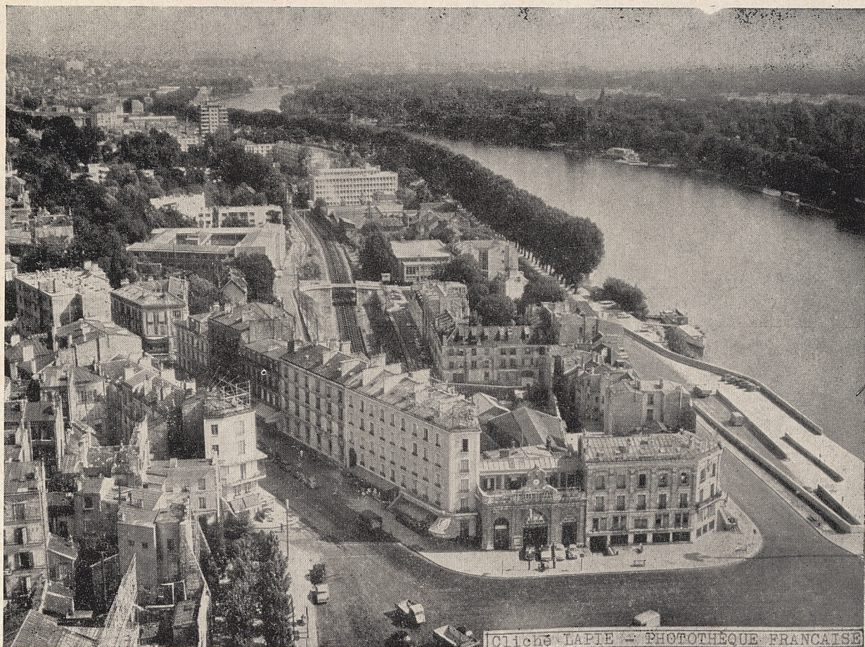
Les rives de la Seine, à Saint-Cloud