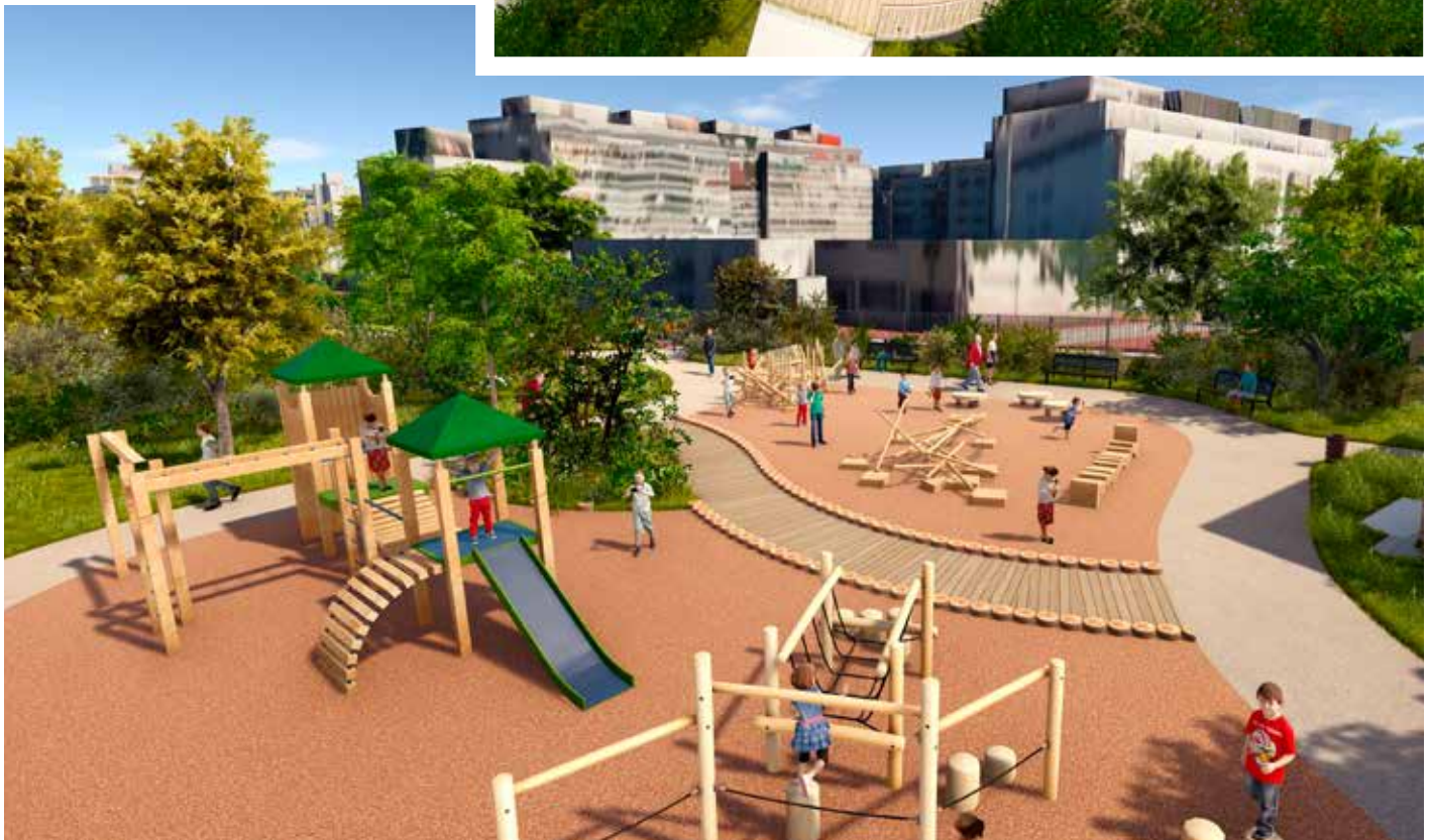
Visuels non contractuels