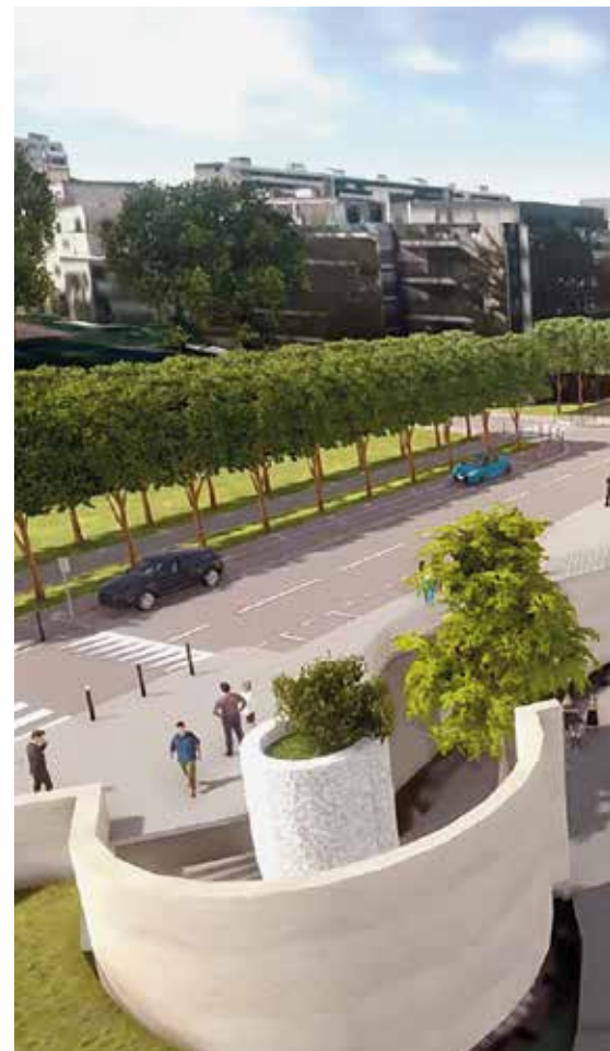
Visuel non contractuel du cinéma-théâtre Les 3 Pierrots.

D'autres sont plus récentes, c'est le cas de l'inflation ou de la baisse des droits de mutations. Cette recette perçue par la Ville lors des transactions immobilières, très dépendante de la conjoncture, devrait rester en berne en 2024.