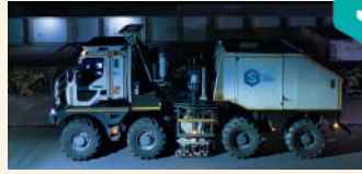
Camion-vibreux Thomas T65