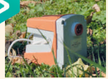
Capteur (largeur ~20 cm)