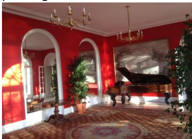
Salon administrateur intérieur

Courte description de la salle et/ou autres informations : Salon avec un jardin privatif dans le domaine national de Saint-Cloud, pour organiser des réunions de travail ou cocktail.