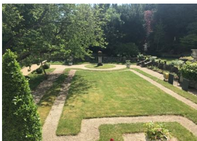
Jardin de l'administrateur