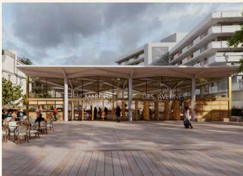
Marché des Avelines.