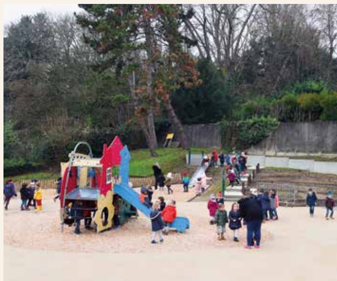
Cour végétalisée de l'école du Centre.

La Ville, au service de ses habitants, se projette dans un programme d'investissement très ambitieux afin de devenir plus durable et d'améliorer la qualité de vie des Clodoaldiens.