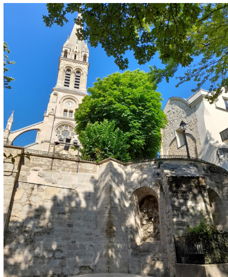
Vue des vestiges de la collégiale et de l'église Saint-Clodoald à Saint-Cloud.

Lorsque vous tournez le dos à la mairie, partez sur votre droite. Rendez-vous sur la placette devant l'église Saint-Clodoald.