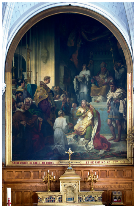
Charles Durupt (peintre), Saint Cloud renonçant au trône , 1831, huile sur toile, Saint-Cloud, église Saint-Clodoald.

Dechaume (1877-1944), de vitraux de Maurice Tastemain (1878-1944) et d'une sculpture de l'artiste clodoaldien Joseph Cirasse (1853-1926).