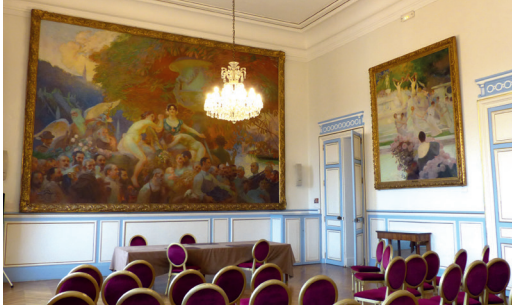
Vue de la salle des mariages de l'hôtel de ville de Saint-Cloud.

Commencez cette flânerie urbaine en vous rendant sur le parvis de l'hôtel de ville de Saint-Cloud, place Charles-de-Gaulle.