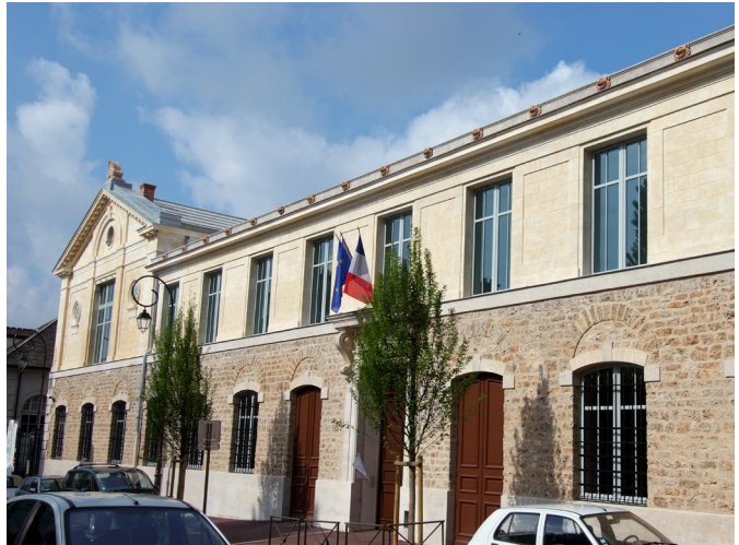
Vue du Carré, établissement municipal, Saint-Cloud.

Vers 1902, le plancher et les combles sont reconstruits selon un procédé de ciment à ossature métallique qui, en cas d'incendie, le rend plus résistant aux flammes. Il abrite