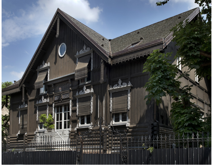
Vue de l'isba de la rue des Écoles, Saint-Cloud.

Au sein du petit village traditionnel russe établi sur le Champ-de-Mars en 1867 se dresse cette isba, exemple d'habitation populaire construite à partir de poutres de bois emboîtées les unes aux autres et aménageable à l'envi. Grâce à la vente des matériaux à la fin de l'Exposition, cette maison est remontée une première fois à Paris (avenue de Villiers, XVII e arrondissement) puis à Saint-Cloud en 1884. Entièrement remaniée pour l'habitation, l'architecture