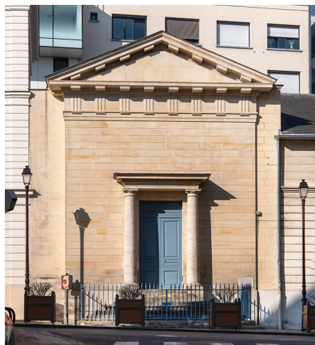
Vue de la chapelle de l'ancien hospice construit par Richard Mique, 1787, Saint-Cloud.

Remontez la rue des Écoles jusqu'à la place Silly et placez-vous devant la chapelle.