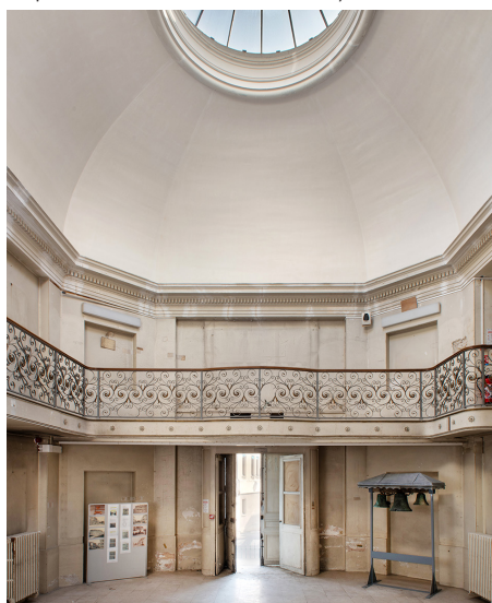
Vue de l'intérieur de la chapelle, Saint-Cloud.

bin Baugin animait jusqu'en 1959 (aujourd'hui conservée dans la cathédrale Notre-Dame de Paris), ainsi qu'un autel de style Louis XIV, provenant peut-être de la chapelle du château de Saint-Cloud. En raison des troubles révolutionnaires, la chapelle n'a jamais été consacrée. Sous la Restauration, une inscription installée par le maire de l'époque, Abraham Silly, est visible : « Chapelle royale de l'hospice fondée en 1787 par S. M. Très Chrétienne Marie-Antoinette, reine de France et de Navarre ». Peu atteinte par les incendies allumés par les troupes prussiennes lors de la guerre de 1870, elle abrite dès 1877 un tableau du peintre Édouard Dantan, La Vocation des apôtres Pierre et André (aujourd'hui déposé au musée des Avelines). ●