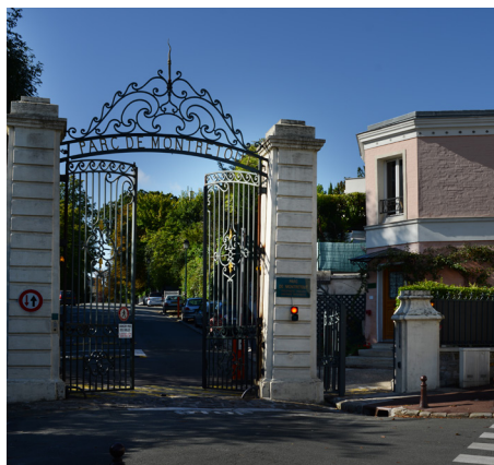
Vue de l'entrée du parc de Montretout, Saint-Cloud.

Contournez l'hôpital par la gauche afin d'emprunter les escaliers de la rue de l'Arcade. Une fois en haut, montez de quelques mètres la rue Gounod pour faire face à l'entrée du parc de Montretout.