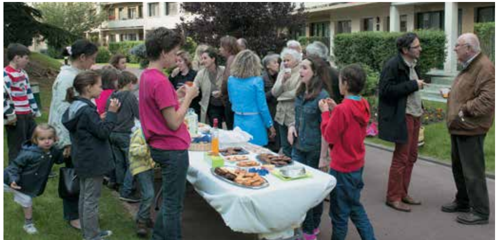
Fête des voisins 2013 à la résidence du Val d'Or.

Saint-Cloud Quartiers est allé à la rencontre de commerçants et de personnalités du quartier Hippodrome/Fouilleuse/Val d'Or.