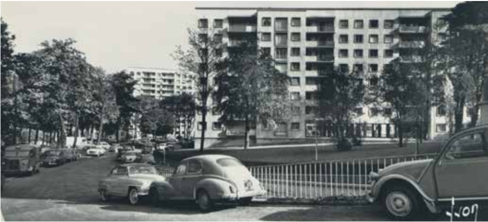
La résidence de la Bérengère.

le nom de « rue du Camp Canadien » pour commémorer leur participation à l'effort de guerre.