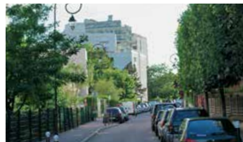
L'avenue de Fouilleuse.

L'avenue de Fouilleuse a fait l'objet d'un important chantier en 2010 : réfection de la chaussée, rénovation de l'éclairage public, travaux d'assainissement, aménagement des accès aux résidences, sans oublier la rénovation du carrefour à feux au croisement des avenues Fouilleuse et Francis-Chaveton. Le parking du Val d'Or a également vu son entrée refaite, l'éclairage remis à neuf et les espaces verts réaménagés. Un parking a aussi été créé dans l'allée des Gymnases . Une réfection des trottoirs a été réalisée sur le pont des 3 Pierrots , et l'éclairage public a été rénové rue Michel-Salles , entre la rue du Camp Canadien et le boulevard de la République. Enfin, au jardin de l'Avre, l'aire de jeux a été réaménagée pour les enfants.