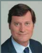
ÉRIC BERDOATI Maire de Saint-Cloud Conseiller général des Hauts-de-Seine