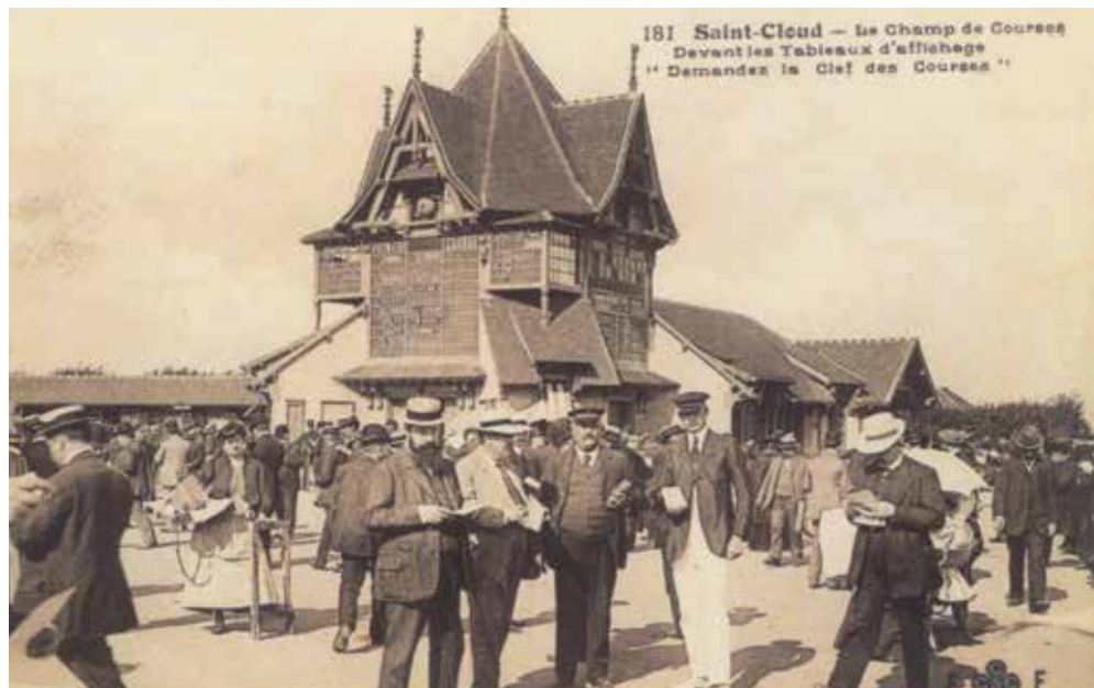
Le champ de courses à ses débuts.

des lieux, avant que l'État ne mette le Domaine de Fouilleuse en vente aux enchères publiques. Le 1 er février 1898, Edmond Blanc, riche éleveur de chevaux de course et député des Pyrénées, remporta les enchères pour 620 000 francs. Le champ de courses de Saint-Cloud, loué par la Société d'encouragement pour l'amélioration du cheval français de demi-sang, fut inauguré en grande pompe le 15 mars 1901 et sa renommée ne tarda pas... Les prix prestigieux qui s'y tenaient, comme celui du Président de la République devenu depuis le Grand Prix de Saint-Cloud, attiraient les foules, si bien que les jours de courses une halte était spécialement établie au Val d'Or sur la ligne du chemin de fer, cela jusqu'en 1907 et l'édification d'une gare. Les parieurs et les promeneurs pouvaient suivre les courses depuis la pelouse centrale. À cette époque, il existait également sur l'hippodrome une ferme qui livrait ses produits laitiers dans de petits attelages. Pendant la Grande guerre, le champ de courses fut réquisitionné pour héberger un hôpital militaire tenu par des Canadiens*. Aujourd'hui, l'artère qui mène à l'hippodrome porte d'ailleurs